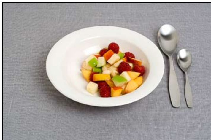
FRUKTSALLAD/BÄR, volymvikt 65 g/dl